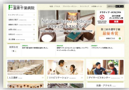
コーポレートサイト「富家千葉病院」