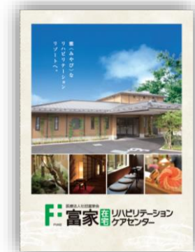
パンフレット「富家在宅リハビリテーションケアセンター」