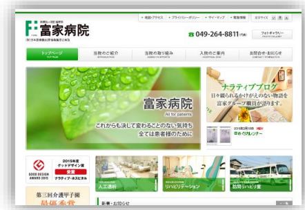
コーポレートサイト「富家病院」