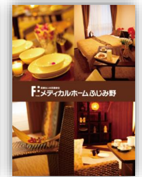
パンフレット「医療ホームふじみ野」