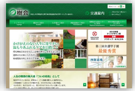
コーポレートサイト「樹会」