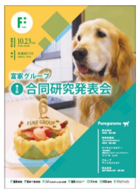
ポスター「合同研究発表会」