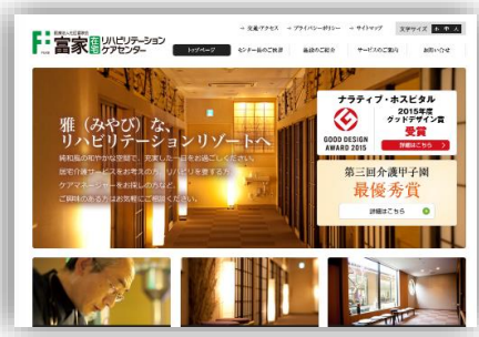
コーポレートサイト「富家在宅リハビリテーションケアセンター」