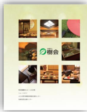
パンフレット「樹会」