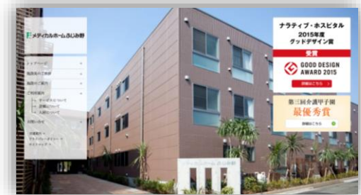
コーポレートサイト「医療ホームふじみ野」